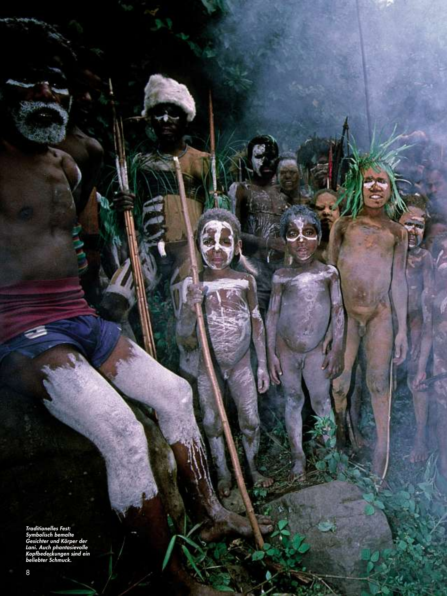
Traditionelles Fest: Symbolisch bemalte Gesichter und Körper der Lani. Auch phantasievolle Kopfbedeckungen sind ein beliebter Schmuck.