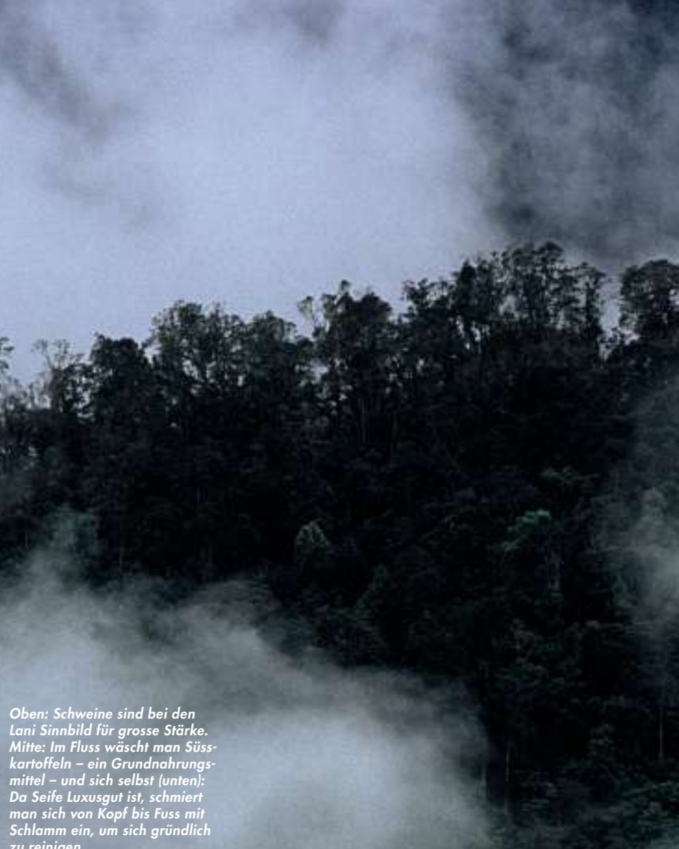
Oben: Schweine sind bei den Lani Sinnbild für grosse Stärke. Mitte: Im Fluss wäscht man Süsskartoffeln – ein Grundnahrungsmittel – und sich selbst (unten): Da Seife Luxusgut ist, schmiert man sich von Kopf bis Fuss mit Schlamm ein, um sich gründlich zu reinigen.