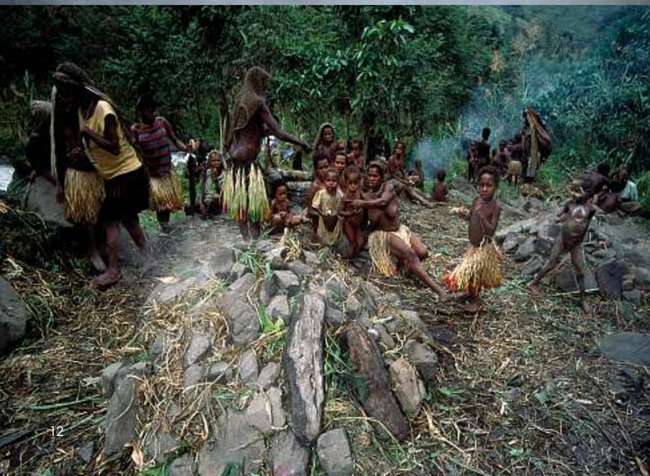
Traditionelles Lani-Fest: Um böse Geister zu besänftigen, wird ein Schwein geschlachtet. Ein Haufen Holz und Steine werden in Brand gesteckt. Später werden unter den heissen Steinen in einer Grube Kartoffeln und das Schweinefleisch gegart.