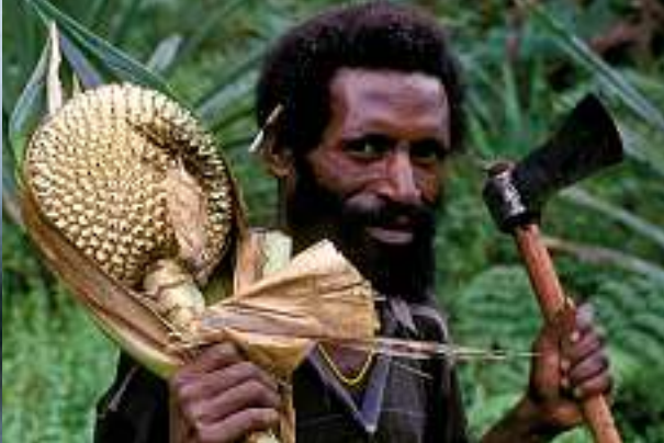
Alltag beim Volk der Lani: Arbeit auf den terrasierten Feldern und buntes Markttreiben. Die tiefrote Frucht «Buch merah» (rechts) wird zu einer dickflüssigen Sauce verarbeitet, die man gesalzen zu Gemüse und Kartoffeln isst.