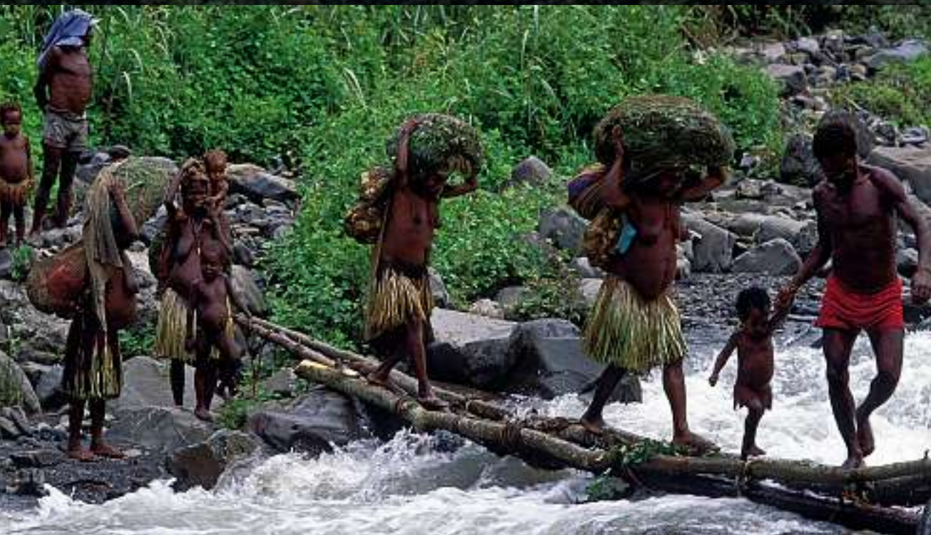
Über wackelige Holzbrücken oder Baumstammstege führt der Weg von Dorf zu Dorf. Die traditionellen Röcke der Frauen aus Gras oder Rotangeflecht sieht man nur noch selten, sie wurden vielerorts durch Textilien abgelöst.