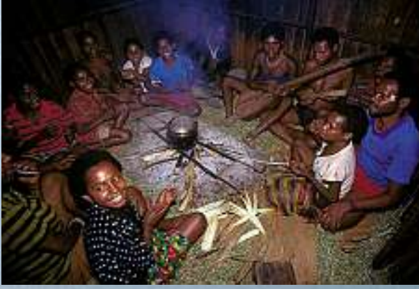
Fröhliche Partnersuche am Feuer: Singend und klatschend machen sich unverheiratete Männer und Frauen über das Feuer hinweg mit den Händen Zeichen, um ihre gegenseitige Sympathie auszudrücken.